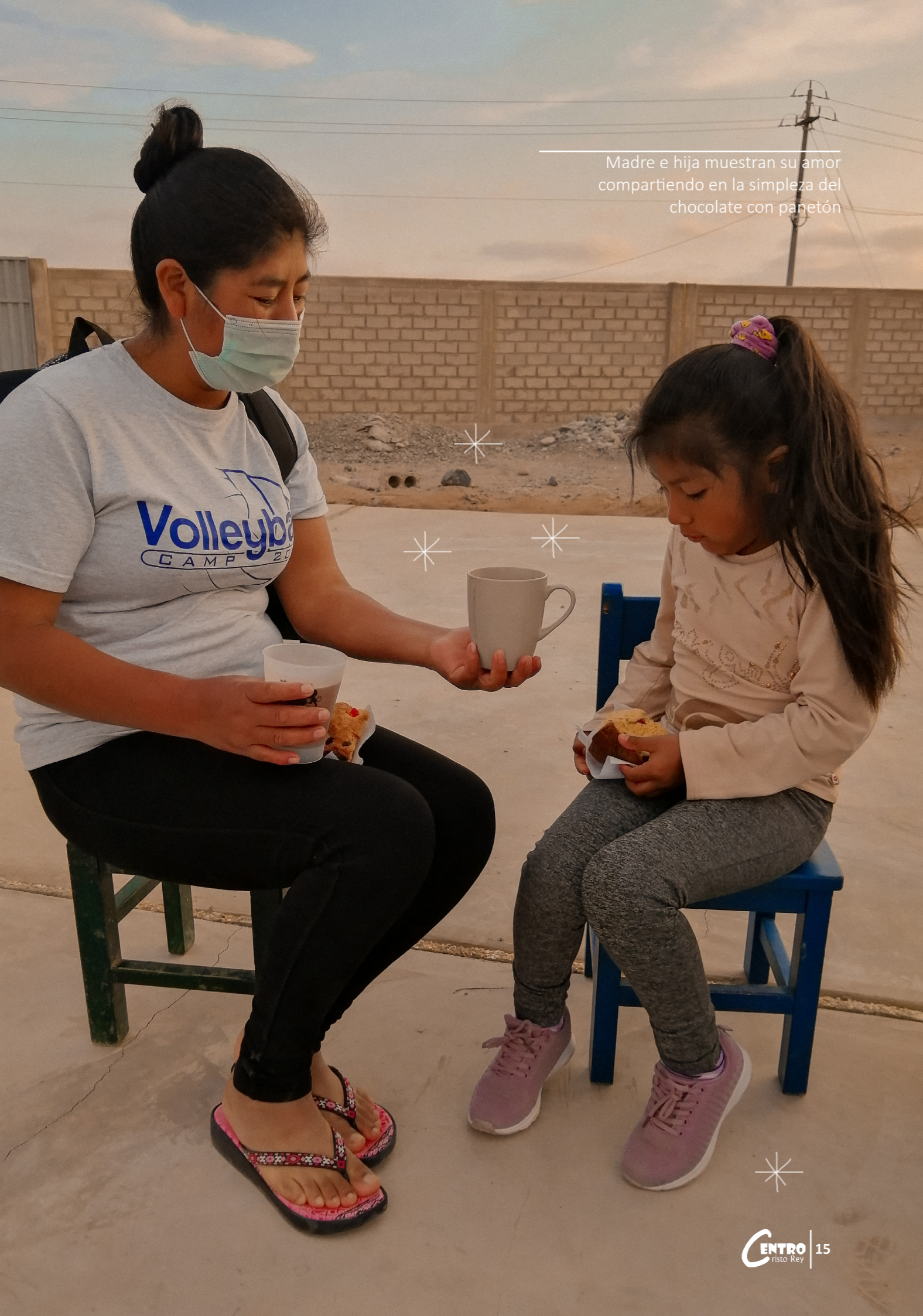
Madre e hija muestran su amor compartiendo en la simpleza del chocolate con panetón