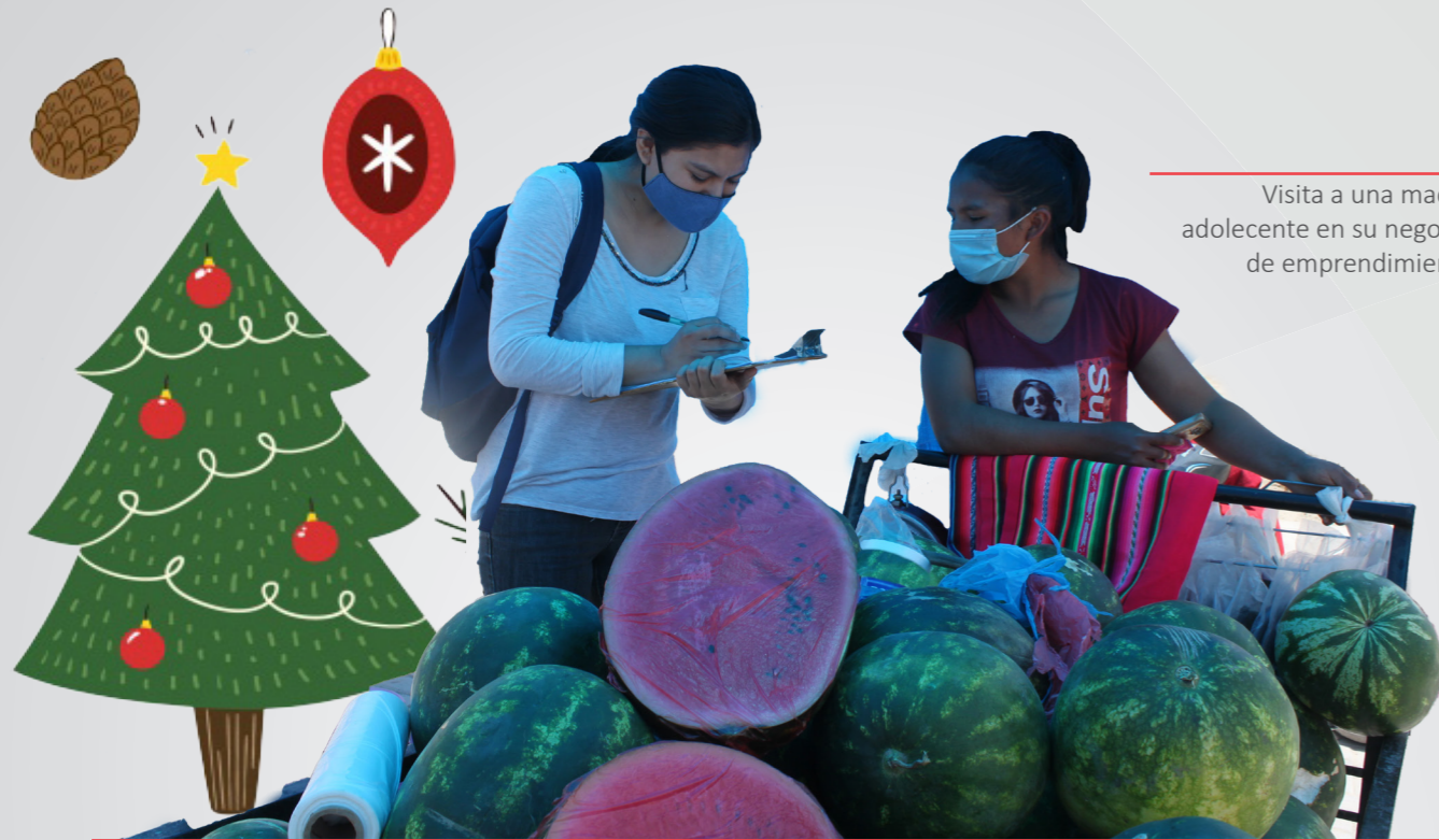
Visita a una madre adolescente en su negocio de emprendimiento

Iniciamos las visitas y capacitación a las madres adolescentes con negocios en formación