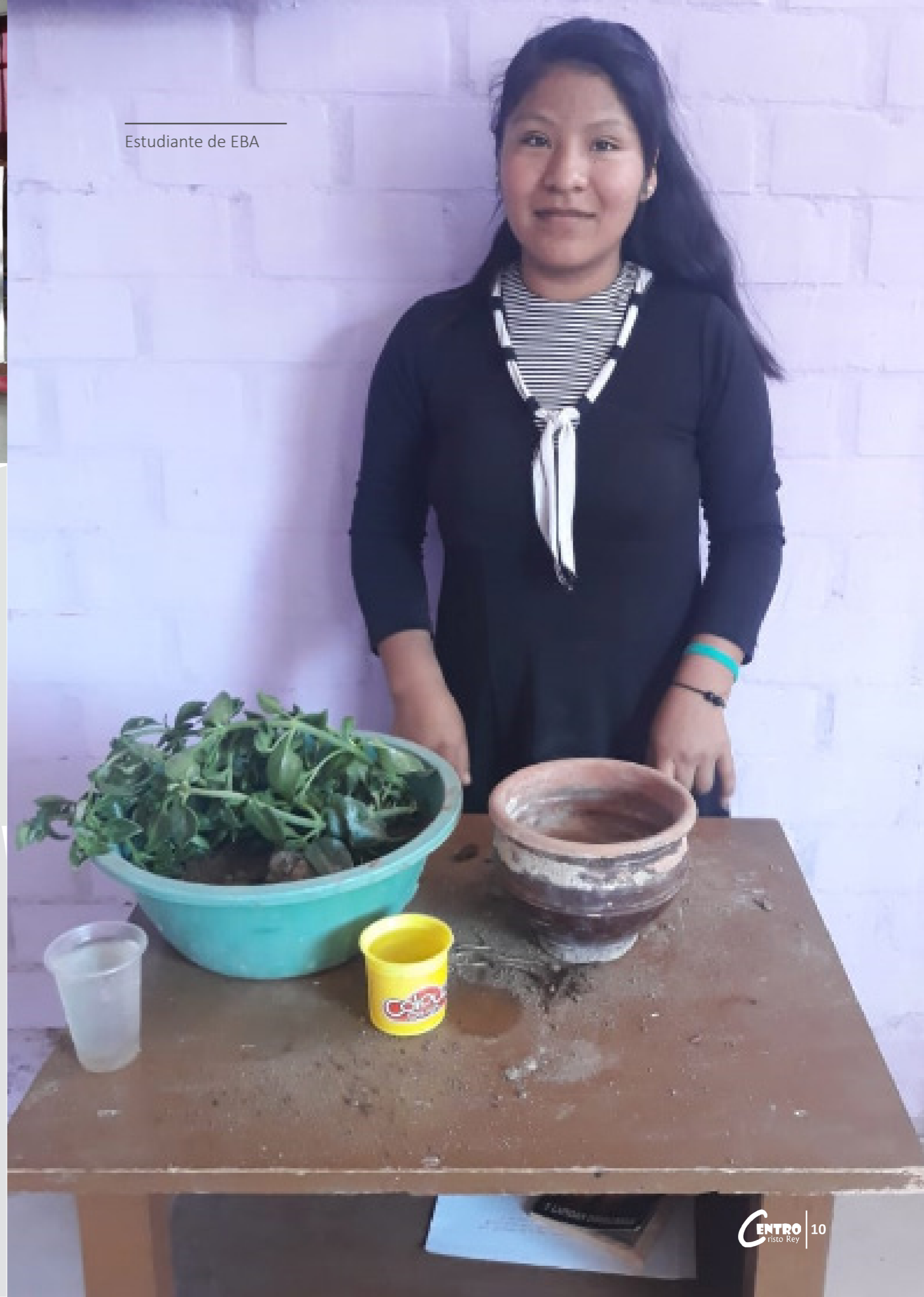
Estudiante de EBA

El involucramiento de la familia ha permitido llevar estos aprendizajes a la práctica, que aunque ahora se dan en menor escala, se espera pueda ser de gran utilidad para que cada familia se anime a contar con verdaderos biohuertos que garanticen el sustento alimenticio del hogar.